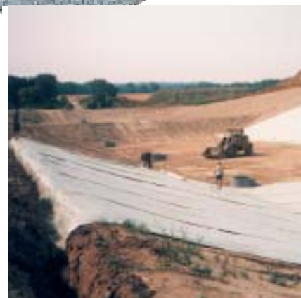
Installation af bentonitmembran på skrænter med anlæg 3 på Klintholm Losseplads.

Natriumbentonit er en naturligt forekommende bredt anvendelig lerart med hundreder af kommercielle og industrielle anvendelsesområder. Men hvordan fungerer bentonit i en bentonitmembran? Natriumbentonit er en lerart hovedsageligt bestående af montmorillonit, et lagdelt lermineral, hvis brede, tynde plader er ideelt formet til brug som en hydraulisk barriere. Natriumioner mellem disse plader tillader vand at hydrere bentonitten i en bemærkelsesværdig absorptionsproces, der resulterer i bentonittens velkendte svulmningsegenskaber. Under hydreringen ændres et indespærret lag af tør bentonit til en tæt, monolitisk masse uden individuelt visuelle partikler. Et fuldt hydreret lag af natriumbentonit kan typisk have en vandledningsevne adskillige gange mindre end et lag af komprimeret ler.